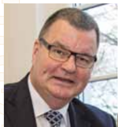
Ihr Matthias Guderjan Bürgermeister

Die Stadt Kenzingen heißt Künstlerinnen und Künstler, Besucherinnen und Besucher herzlich willkommen. Zur Vernissage im Bürgerpark am Montag, den 11. September um 17.00 Uhr, zur Finissage am Sonntag, den 17. September um 11.30 Uhr und natürlich auch für die Tage dazwischen sind alle Interessierten ganz herzlich eingeladen. Auf Wiedersehen im Alten Grün sagt